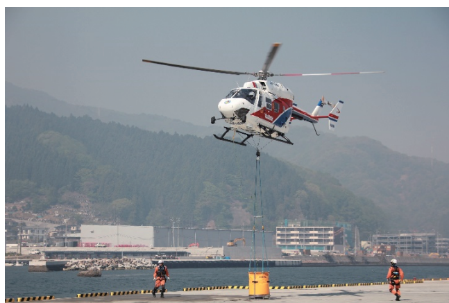
岩手県釜石市の林野火災へ出動する 秋田県消防防災ヘリコプター