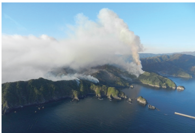
岩手県釜石市の林野火災（平成29年5月）